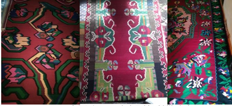
Fotoğraf: 2-3-4, Sarı Saltuk Tekkesi kilimleri (Fotoğraf: F. Akpınarlı arşivi).