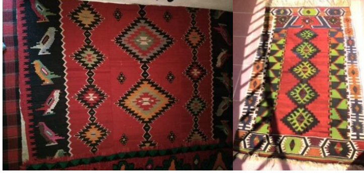
Fotoğraf: 14, Tekkede bulunan kilim.