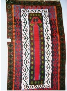
Fotoğraf: 22, Tekkede bulunan kilim. Fotoğraf:23-24, Konya Obrukve Konya Hotamış kilimi

Tekkede bulunan orta kompozisyon alanı kırmızı renkli ve geometrik halde hayat ağacı olan kilimin benzerleri Konya bölgesi kilimlerinde de rastlanır.