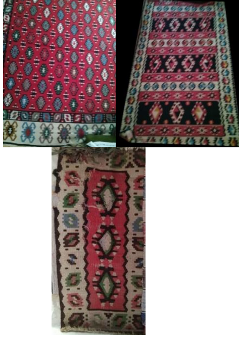
Fotoğraf: 8-9-10, Sarı Saltuk Tekkesi kilimleri (Fotoğraf: A. Aytaç arşivi).