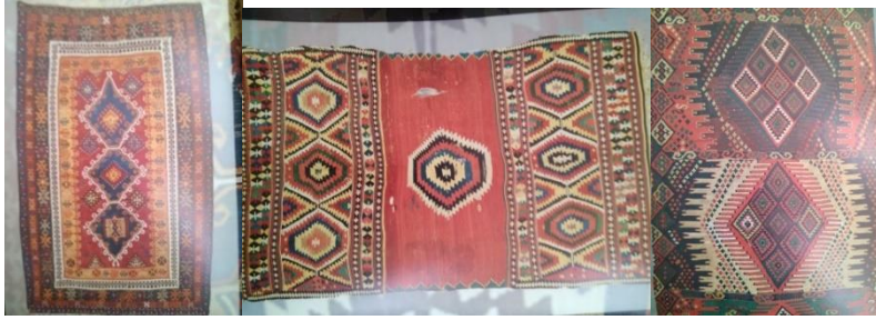
Fotoğraf: 11-12-13, Kayseri Yahyalı, Aydın Helvacıköy ve Anadolu kilimi 6 .

Tekke'de bulunan bir grup kilimde bıçkır yanışının raport halde tüm zemini kapladığı kompozisyonlar vardır. Orta kompozisyon alanında serbest