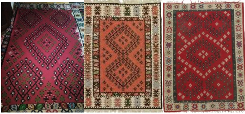
Fotoğraf: 19, Tekkede bulunan kilim (A. Aytaç arşivi). Fotoğraf:20-21, Tekirdağ Şarköy kilimi (A. Aytaç arşivi).

Tekkede bulunan kırmızı renkli kilimin orta merkezinde büyük dört tarafında da biraz daha küçük ölçekli ayrıca yatım ve dikim istikamette de kenarlarda yarım halde madalyonlar vardır. Benzer desen şemalarına Tekirdağ Şarköy'de rastlanabilir.