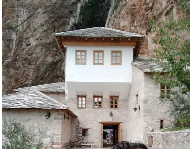
Fotoğraf: 1: Sarı Saltuk (Alperenler) Tekkesi.

Bosna-Hersek'in Mostar kenti yakınlarındaki Blagay Sarı Saltuk (Alperenler) Tekkesi, 600 yıl önce Buna Nehri'nin kaynağına kurulmuştur. Restore edilen ve günümüzde ziyarete açık olan tekkenin içerisinde ayrıca Sarı Saltuk'a atfedilen bir mezar bulunuyor.