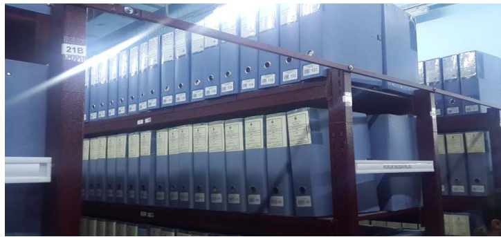
Şekil 2: İstanbul Büyükşehir Belediyesi Yerel Yönetim Arşivi