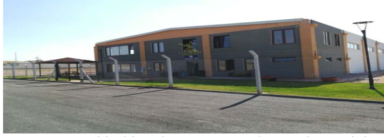
Şekil 4: Eskişehir Odunpazarı Yerel Yönetim Arşivi

Odunpazarı Belediyesi tarafından, belediyeye ait evrakların sağlıklı bir ortamda arşivlenebilmesi için modern bir arşiv binası inşa edilmiştir.