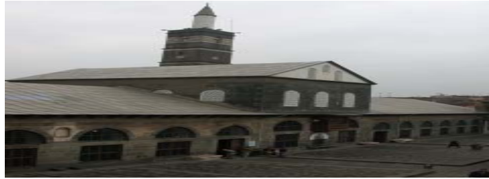
Şekil 3: Diyarbakır Büyükşehir Şehir Belediyesi Yerel Yönetim Arşivi

Belediyenin Fotoğraf Arşivi tutulmaktadır. Arşivin dışarıdan bir görüntüsü Şekil 3'de verilebilir.