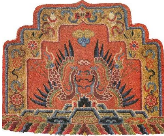
Resim 14: Doğal boyalı taht arkalığı, yün atkı, pamuk çözgü, 76x64 cm., 20. yy. başı (Chodrak ve Tashi, 2000, s. 118)