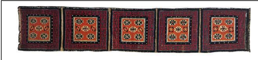
Resim 17: Tsokden, 190x38 cm., pamuk çözgü, yün atkı ve hav. (Page, 1994, 141).

Khaden ile yaklaşık aynı genişlikte fakat daha uzun olan yolluk tipindeki halılardır (Resim 17). Bu tip halılarda desen, lotus çiçeği gibi motiflerin ve madalyonların yan yana tekrar etmesi ile oluşmaktadır. Tekrar eden ve bazı örneklerde kare içine alınan her birim kişinin oturacağı yeri göstermektedir. Toplantı odası ve şapel gibi yerlere serilmekte ve dini törenlerde keşişler üzerinde dua etmektedir.