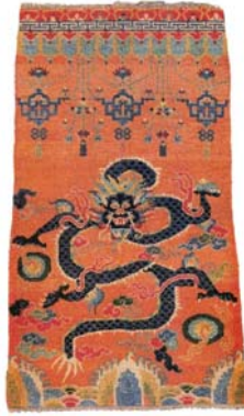
Resim 24: Beş pençeli imparator ejderinin değerli bir taş ile tasvir edildiği doğal boyalı kathum, 137x70 cm. (üst), 82 cm. (alt), Yün çözü, pamuk atkı, 20. yy. başı (Chodrak ve Tashi, 2000, s.110).

Kathum; manastırlar için dokunmuş dekoratif kapı örtüsüdür. Genellikle değerli bir taş tutan bir ejderha ile süslenmiştir (Resim 24).