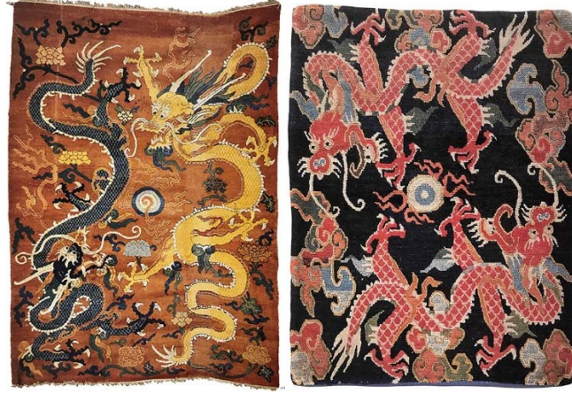
Resim 1: Sol taraftan; Çin halısı, (Eiland JR ve Eiland III, 2008, s. 306), Tibet halısı (Chodrak ve Tashi, 2000, s.140).

Tibet halılarında desenler çok çeşitlilik göstermekte ve bunlar figürlü, madalyonlu, serpmeye desenli ve desensiz olmak üzere dört ana gruba ayrılmaktadır.