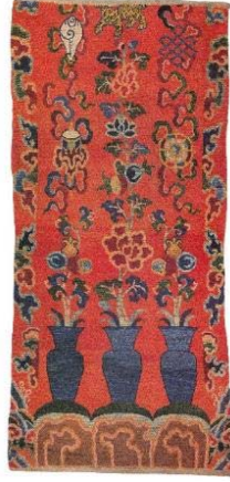
Resim 23: Doğal boyalı goyo, yün atkı, pamuk çözü, 204x92 cm. (üst), 99 cm. (alt), 20. yy. başı (Chodrak ve Tashi, 2000, s.115).