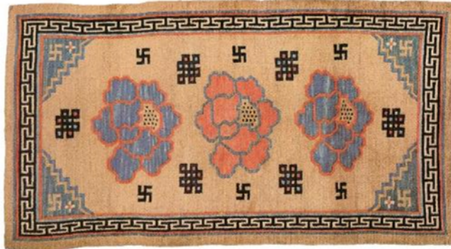
Resim 10: Lotus çiçeği madalyonlu, doğal boyalı bir khaden, yün atkı ve çözgü, 166x76 cm., 19.yy. sonu-20.yy. başı (Chodrak ve Tashi, 2000, s.85).

Keşişler manastırdaki odalarında uyumak için halılarını evlerinden getirirler. Halının kalitesi ve deseni keşişin aile geçmişini yansıtmaktadır. Budist semboller ile hayvan figürleri, bitkisel ve geometrik motifler ve madalyon, başlıca desen elemanlarıdır.