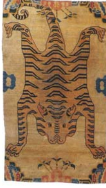
Resim 3: Yüzülmüş kaplan derisi desenli bir khaden, 19. yy. (Hali Magazine, Sayı 110, 2000, s. 7).

Miine Taylan Tibet Halılarının Kullanım Alanları