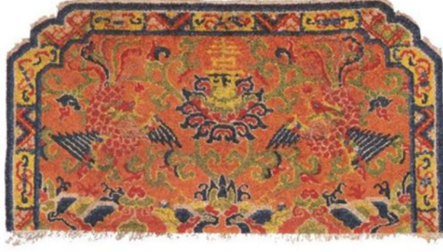
Resim 15: Sentetik boyalı arkalık, pamuk atkı, yün çözgü, ipek hav, 124x65 cm., 20. yy. ortası (Chodrak ve Tashi, 2000, s.121).