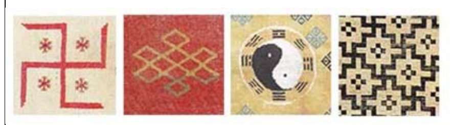
Resim 7: Sol taraftan; gamalı haç (Myers, 2009, s. 51), sonsuz düğüm (Hali Magazine, Sayı 116, 2001, s. 13), yin ve yang (Hali Magazine, Sayı 49, 1990, s. 28), muska (Hali Magazine, Sayı 49, 1990, s. 27).

Desensiz halılarda ise zemin boş bir alan olup çoğunlukla tek renktedir. Bu tip halılarda nadiren bordüre rastlanmaktadır.