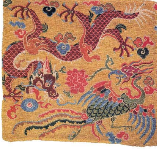
Resim 11: Beş pençeli imparator ejderinin değerli bir taş tutarken simurg ile tasvir edildiği doğal boyalı bir khagangma, 88x80 cm., yün atkı ve çözü, 20. yy. başı (Chodrak ve Tashi, 2000, s.132).