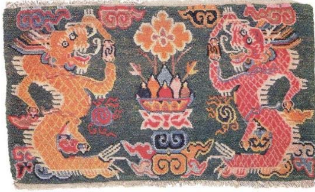
Resim 13: Değerli bir taş tutan ejder desenli, doğal boyalı bir gyabney, 63x36 cm., yün atkı ve pamuk çözgü, 20. yy. başı (Chodrak ve Tashi, 2000, s.141).

Minder kılıfı olarak dokunan halılardır. Arkalık olarak kullanılırlar (Resim 13, Resim 15). Ayrıca saygın lamaların oturduğu tahtlar için de arkalık dokunmuştur. Bunlar genellikle deniz kabuğu şeklinde olup lamanın saygınlığını ifade eden ying-yang, ejder, simurg gibi Budist semboller ile süslenmiştir (Resim 14). Ayrıca 20. yüzyılda bisiklet minder kılıfı dokunduğu bilinmektedir (Myers, 2009, s. 48).