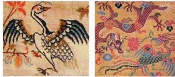
Resim 2: Sol taraftan; kuş (Myers, 2009, s. 47), ejder ve simurg (Chodrak ve Tashi, 2000, s. 132).

Hayvan figürleri arasında kaplan, kuş, ejderha ve simurg başlıca elemanlardır (Resim 2). Kaplan desenli halılar tek başına bir halı grubu oluşturacak kadar fazladır (Resim 3). Ejderha genellikle değerli bir taşı tutarken tasvir edilir. İnsan figürü, kafatası, iskelet ve yüzülmüş derilere daha çok manastır için dokunan Tantrik halılarda rastlanmaktadır (Resim 4).