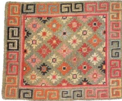
Resim 12: Sentetik boyalı shugden, yün atkı ve pamuk çözü, 72x60 cm., 20. yy. başı (Chodrak ve Tashi, 2000, s.135).

Özel misafirlere sunulan bir oturma halısıdır. Ejder ve simurg, vazo içinde çiçekler, madalyonlar ve bulut motifleri ile süslediği gibi, serpm çiçek desenli örnekleri de vardır (Resim 12).