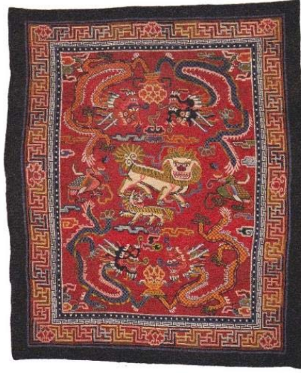
Resim 22: Doğal boyalı sapden, yün atkı, pamuk çözgü, 215x182 cm., 20. yy. başı (Chodrak ve Tashi, 2000, s.120).

Taban halısı olarak dokunan Tibet halılarına sapden denmektedir (Resim 22). Yalnızca soylular ve saygın lamaların sahip olduğu büyük ebatlardaki bu halılar, özel törenler ve kabul günlerinde kullanılmaktaydı. Fakat geleneksel Tibet tezgahlarının eni dar olduğundan bu tip halılardan çok dokunmamıştır. Evlerde kullanılan taban halıları 1950'lerin sonuna kadar khaden boyutunda parçalar halinde dokunmuştur. Daha sonra devlet tarafından açılan atöyelere geniş tezgahlar temin edilmiş ve halılar tek parça halinde dokunmuştur.