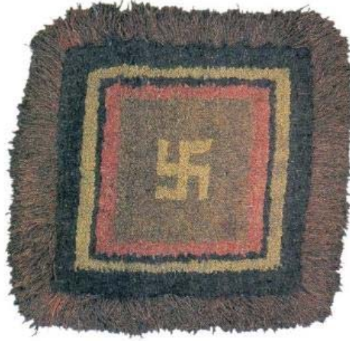
Resim 16: Doğal boyalı meditasyon minderi, 75x75 cm., yün atkı ve çözgü, 19.-20. yy. (Chodrak ve Tashi, 2000, s.74).