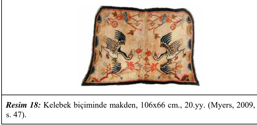
Resim 18: Kelebek biçiminde makden, 106x66 cm., 20.yy. (Myers, 2009, s. 47).

Makden adı verilen eyer örtüleri iki parçalı takım halinde dokunurlar (Resim 18). Parçalardan biri eyerin altına diğeri ise üstüne serilir. Bu takımlardan günümüze çok fazla örnek ulaşamamıştır. 20. yüzyıla ait örnekler çoğunlukla kelebek şeklinde olup İngiliz asker atlarının eyer örtülerine benzemektedir (Resim 19). Ancak bunlarda geleneksel Tibet eyer örtülerinde bulunan kayış deliklerinden yoktur (Myers, 2009, s. 46).