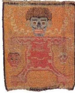
Resim 4: Yüzülmüş insan derisi tasvirli taht örtüsü, 76x61 cm., 18. yy. (Hali Magazine, Sayı 62, 1992, s. 09).

Madalyon; bitkisel ve geometrik olmak üzere iki çeşit kullanılmıştır (Resim 5).