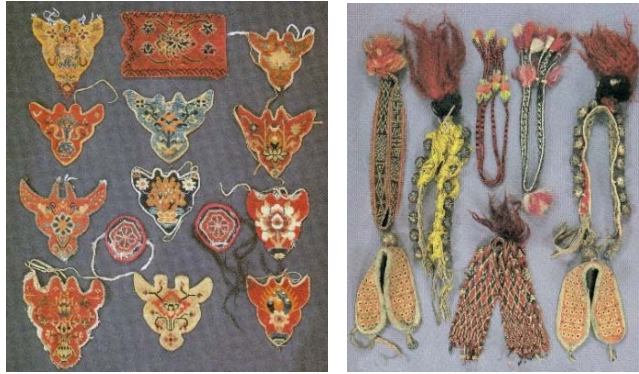
Resim 21: Takyab ve hayvan süsleri (Chodrak ve Tashi, 2000, s.69-70).

At, eşek ve katır gibi binek ve yük hayvanlarını süslemek amacıyla dokunmuş, özellikle hayvanın başına takılan, şans getirdiğine inanılan ve bunu temsil eden motiflerle süslenmiş dokumalardır. Hayvan süslerinin havlı ve havsız olanları vardır (Resim 21).