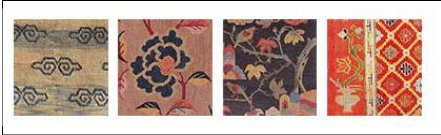
Resim 6: Sol taraftan; bulut (Hali Magazine, Sayı 98, 1998, s. 20), lotus (Hali Magazine, Sayı 75, 1994, s. 122), hayat ağacı (Hali Magazine, Sayı 54, 1990, s. 158), çiçek (Myers, 2009, s. 51).

Serpme desenli halılarda kompozisyon, geometrik ve bitkisel motiflerin yanı sıra bulut motifinin birim tekrarı ile zemine yerleştirilmesi ile oluşmaktadır. Budist sembollerden biri olan lotus çiçeği, hayat ağacı ve çeşitli meyveler ile bu meyvelerin çiçekleri başlıca bitkisel motifleri oluştururken (Resim 6); gamalı haç, sonsuz düğüm yin ve yang ile muska halılarda en çok kullanılan geometrik motiflerdir (Resim 7).