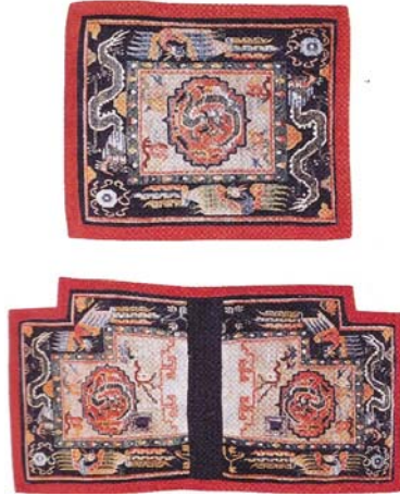
Resim 19: Doğal boyalı makden, yün atkı, pamuk çözüğü, üst parça; 74x60 cm., alt parça; 126x63 cm., 20. yy. (Eiland JR ve Eiland III, 2008, s. 342).