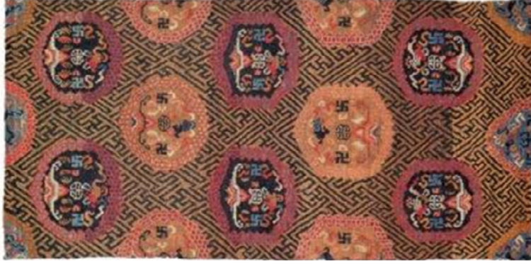
Resim 9: Tsang ailesine ait doğal boyalı bir khaden, yün atkı ve çözgü, 142x75 cm., 20.yy. başı (Chodrak ve Tashi, 2000, s. 93).

Keşişler manastırdaki odalarında uyumak için halılarını evlerinden getirirler. Halının kalitesi ve deseni keşişin aile geçmişini yansıtmaktadır. Budist semboller ile hayvan figürleri, bitkisel ve geometrik motifler ve madalyon, başlıca desen elemanlarıdır.