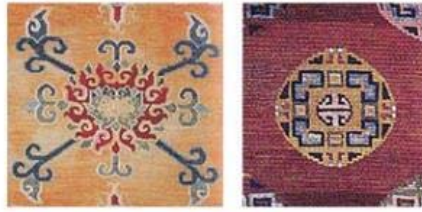
Resim 5: Sol taraftan; bitkisel madalyon (Hali Magazine, Sayı 103, 1999, s. 120), geometrik madalyon (Hali Magazine, Sayı 105, 1999, s. 11).

Madalyon; bitkisel ve geometrik olmak üzere iki çeşit kullanılmıştır (Resim 5).