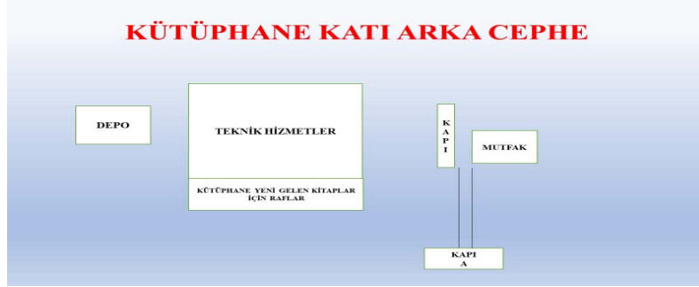
Şekil 2: Kütüphane Katı Arka Cephe Krokisi