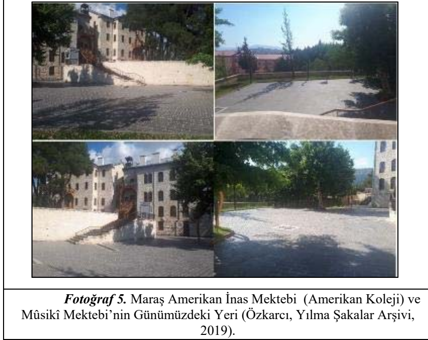
Fotoğraf 5. Maraş Amerikan İnas Mektebi (Amerikan Koleji) ve Mûsikî Mektebi'nin Günümüzdeki Yeri.

Fotoğraf 5'te, günümüz Yedi Güzel Adam Edebiyat Müzesi olarak hizmet vermekte olan Maraş Amerikan İnas Mektebi'nin bina ve çevresinden kesitler görülmektedir. Belgelerden edindiğimiz yer ve yön bilgilerine dayanarak Maraş Mûsikî Mektebi'nin fotoğraflarda yer alan boş alanda 1914 yılında inşa edildiğini söyleyebiliriz. Günümüzde ise bu yer park/seyir alanı olarak kullanılmaktadır.