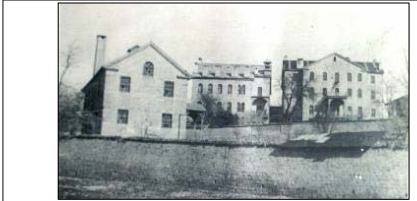
Fotoğraf 3. Eski Maraş'ta Misyoner Okullarından Bir Görünüm (Alparslan, 2018:95)

Mektebin zemin katına, doğu cephenin güney köşesinde açılan dikdörtgen kesitli ve sundurmalı cümle kapısından geçilerek giriş mekânına ulaşılmaktadır.