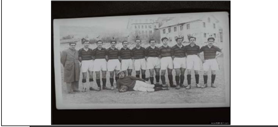
Fotoğraf 2. Amerikan Kız Koleji Önünde Çekilmiş Bir Fotoğraf, (t.y.)