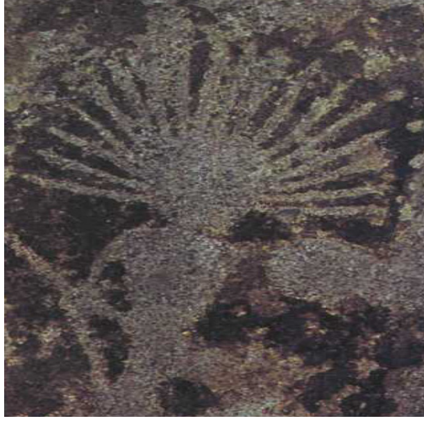
Fotoğraf 1: Altaylar, Karakol'da bulunan mezar levhası üzerinde Şaman tasviri, MÖ 2000.

Eski Sovyet şimdiki Rusya sınırları içerisinde olan Sibiryâ bölgesi geçmişten günümüze önemli Şamanlık (Kamlık) verilerini barındırmaktadır. Türk Şamanlığı konusunda klasik literatür çoğunlukla Sibiryâ üzerinde odaklanmıştır. Dünyanın birçok ülkesinde varlık gösteren Şamanların ayrıca; Kuzey ve Güney Amerika, Avustralya, Endonezya, Güney-Doğu Asya, Çin, Tibet ve Japonya'da yoğunlaştığı bilinmektedir. Şamanlık sisteminin ülkeler ve bölgeler arası farklılıklarının yanı sıra aynı bölgenin değişik halkları arasında da farklılıklar görülmektedir. Konumuzun sınırlarını çizen Sibiryâ bölgesi Türk Şamanlarının farklı topluluklarında olduğu gibi kostüm biçimleri ve eklerinin semantik yorumlarında bazı ayrılıklar söz konusu olmaktadır 3 .