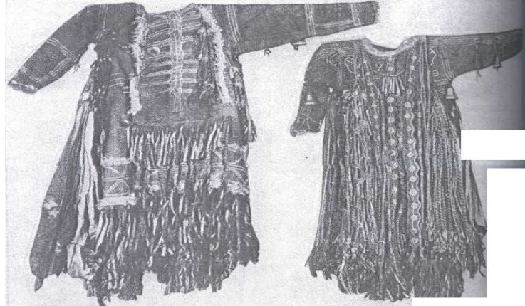
Fotoğraf 3: Şaman Giysilerinde İskelet Simgeciliği, Tofalar (Akademia Nauk Soyuzu Sovetskix Sossialistiçeskih Respublik,İnstitut Etnografi İmeni N. N. Mikluho Malaya)

Tüm Şaman topluluklarında olduğu gibi Sibiry Türk Şaman topluluklarında da en çok görülen simgecilik türlerinden birisi kuş simgeciliği diğeri ise iskelet simgeciliğidir.