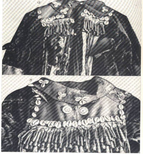
Fotoğraf 2 : Hakas Şaman kostümünün önden ve arkadan görünüşü. (Akademia Nauk Soyuzu Sovetskix Socialističeskih Respublik, İnstitut Etnografi İmeni N. N. Mikluho Malaya, s. 70,71)

Hakaslara ait ünik bir örnekte dikiş tarzı ve tasarım bakımından farklılık görülmektedir. Giysi düz sırt kesimlidir. Ayrıca Altay ve Hakas kostümlerinde diğer kostümlerden ayırt edici bir özellik olan göğüslük bulunmadığı hâlde bu giyside göğüs levhası bulunmaktadır. Bu özellik kostümü Tofalar ve Tuvaların kostümlerine yaklaştırmaktadır. Giysinin sırtında bulunan askıda kanatları kapalı bir kuşun metalik tasviri vardır. Bu tasvire sık rastlanmayıp Ketlerin çelenklerinde olan kuş tasvirlerine benzemektedir. İşlev ve mana bakımından fazla bir önemi olmamakla birlikte giyside metalik askılar ve yakaya dikilmiş kürk parçaları da mevcuttur 23 .