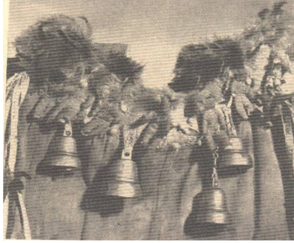
Fotoğraf 4: Şaman Cübbesi Üzerindeki Askılar, Kuklalar, Çanlar, Puhu Kuşu Telekleri- Altaylar. (AEM Kol. No:5064-2)

Onun kostümü “hamton” ya da “manyak”tır 37 . Altaylarda giysinin üzerinde gök kızlarını temsil eden içleri kürkle doldurulmuş kuklalar bulunmaktadır.