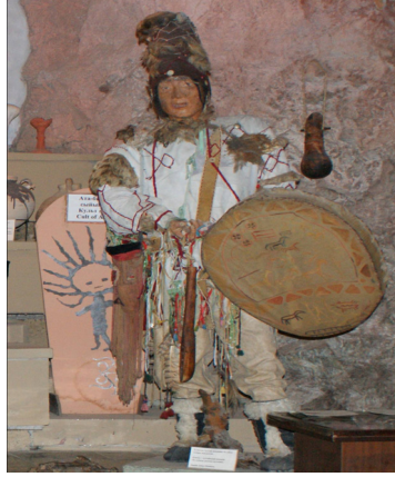
Fotoğraf 2: Oş Şehri Müzesi Şaman Seksiyonu, Kırgızistan

Şaman'ın bedenini reel dünyadan koparıp kozmik ve sınır ötesi âleme götüren vasıta içinde ruhların yerleştiği elbisesidir. Yardımcı ruhların çoğu giyside yaşadıklarından kötü ruhlardan hem fiziksel olarak hem de manevi olarak giysiler ve üzerlerindeki ekler sayesinde korunurlar. Bu nedenle Şamanlar ruhlardan ilk olarak “manyak” yapmak için izin almışlardır. Her ne kadar özel kostüm giyilmeden giysi kadar önemli olan yalnızca davul ile de ayin yapılabilindiği gibi asıl kamlık giysi ile yapılandır 27 .